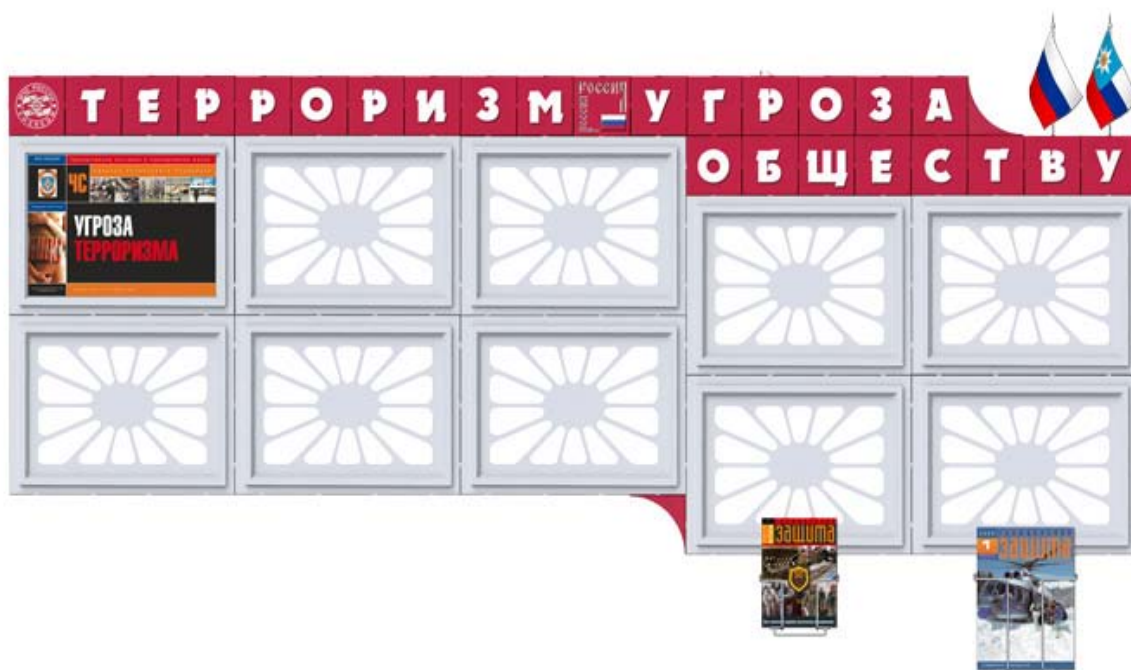
Стенд "Терроризм - угроза обществу" Размеры: 2,5 x 1,0 м Цена: 6650 руб.

Подвесные карманы для памяток, брошюр, журналов А4 -165 руб., А5 - 132 руб. Флажки (Россия - 150 руб., МЧС - 300 руб.)